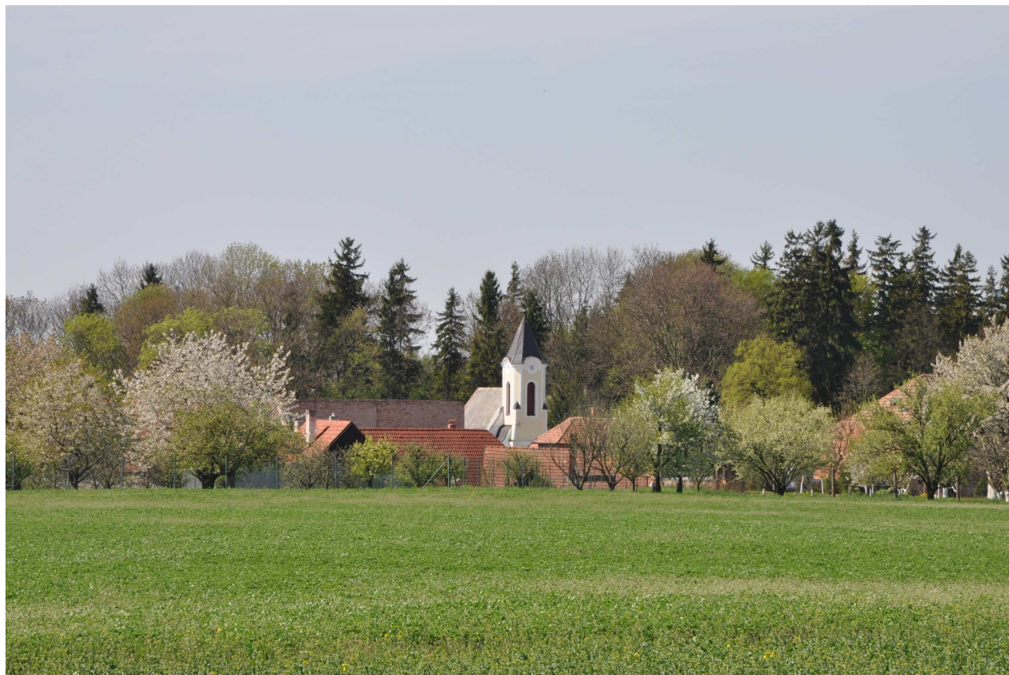
Autor: Ben Skála